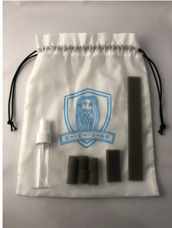
「アマビエ」をモチーフにした オリジナル巾着袋、スプレーボトル、 スポンジ予備付き