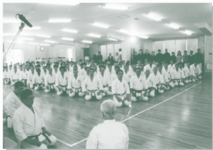
総勢209名が参加しました